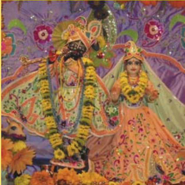
Sri Sri Radha Madan-Mohan ISKCON Goloka Dham, Abentheuer

ISKCON Abentheuer ist Deutschlands einziger Radha Krishna-Tempel. Diese Radha Madan-Mohan Deities wurden persönlich von A. C. Bhaktivedanta Swami Prabhupada gesehen. Goloka Dham ist ein Pilgerort für alle in Deutschland lebenden Hindus und ein Ort der Bildung in der Vedischen Kultur.